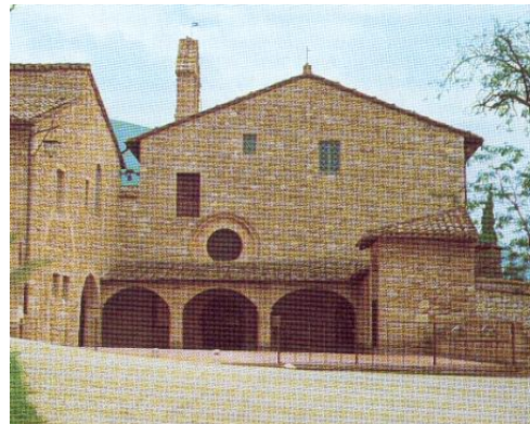
rechts: Die Kirche von San Damiano am Rand von Assisi