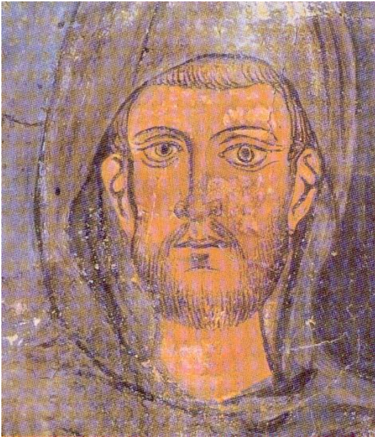
oben: Franziskus nach einem Fresko im Kloster Subiaco, möglicherweise noch vor 1228